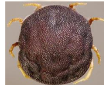
ရောဂါပိုးသယ်ဆောင်သည့်မွှား