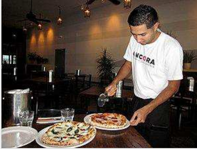
အန်ကိုရာမှ ဝန်ထမ်း တစ်ဦး