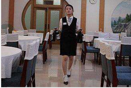
ဆမ်ရီယွန် ဘန်ဂီဘောင်း ဟိုတယ်မှ စားပွဲထိုးမယ်၊ မြောက်ကိုရီးယား