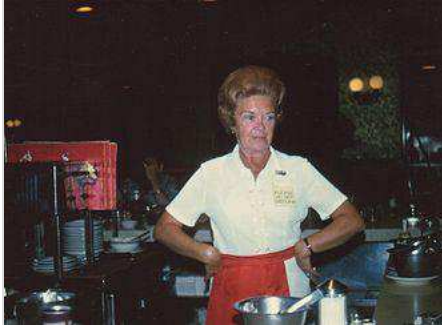
မီယာမီ ကမ်းခြေမှ စားပွဲထိုးမယ် တစ်ဦး ၁၉၇၃ ခုနှစ်

စားသောက်ဆိုင်တွင် ဝန်ဆောင်မှုပေးသည့် ရာထူးအတွက် စားသောက်ဆိုင်ရှိ အထက်အရာရှိမှ ချုပ်ကိုင်ထားလေ့ရှိသည့် လေ့ကျင့်မှုများ လိုအပ်သည်။ ဝန်ဆောင်မှုပေးသူသည် ဝယ်ယူအား ကောင်းမွန်သော ဝန်ဆောင်မှုပေးခြင်း၊ စားစရာ နှင့် သောက်စရာတွင် ပါဝင်သောအရာများအား လေ့လာခြင်း၊ သေသပ်ပြီး နေရာကျသော